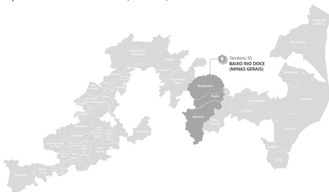
Mapa 1. Microterritório 10. Baixo Rio Doce (Minas Gerais)

A construção deste documento parte da leitura contextual dos territórios e das agendas previstas/em execução dos demais programas , numa perspectiva integrada dos diferentes temas pertinentes à reparação, considerando as expectativas e necessidades locais, bem como as responsabilidades da Fundação Renova e limites impostos pelo TTAC. Em seguida, baseado nesse enquadramento, são delimitadas as agendas prioritárias do PG06 e Gerência de Diálogo e Canais de Relacionamento , que consideram os aspectos de maior centralidade para a reparação do território.